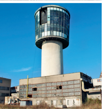
Wieża górnicza kopalni Staříč / Těžní věž dolu Staříč