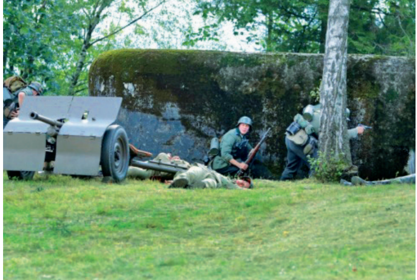
Schrony bojowe / Bojové úkryty