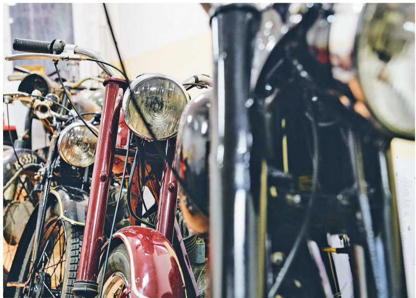
Muzeum Motóra w Korbiewowie / Muzeum Motora w Korbiewów

V Korbiewów ve Sboru dobrovolných hasičů je Muzeum motocyklů z období komunismu. Najdete zde mnoho unikátních exponátů. Muzeum funguje na dobrovolné bázi a vzniklo z lásky k automobilovému průmyslu.