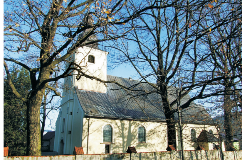
Kościół w Jeleśni / Kostel v Jeleśni

V bývalém varhaníku u kostela v Jeleśni je Regionální komora tvůrčí práce, kde