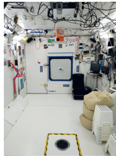
Stacja Kosmiczna YSS / Vesmírná stanice YSS

Sdružení POLARIS - OPP sídlí v Sopotni Wielka. Jde o organizaci zabývající se inovativními formami popularizace exaktních věd tykajících se široce chápaného prostoru a nebe. Vynínila celoregionální inovativní ASTRO-TURISMUS, kde mezi hlavní atrakce dostupné návštěvníkům regionu patří: Vesmírná stanice YSS - jedná se o model interiéru jednoho z modulů Mezinárodní vesmírné stanice ISS v poměru 1:1. Zde se konají palubní projekce, kterých se může najednou zúčastnit cca 15 osob.