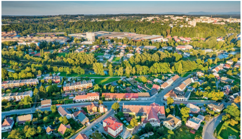
Widok na Sviadnov / Pohled na Sviadnov

Gmina Sviadnov to średniej wielkości gmina położona w powiecie Frydek-Mistek w sąsiedztwie miasta statutowego Frydek-Mistek. Sviadnov ma raczej charakter przemysłowy z silnym zapleczem dla firm i biznesu, obejmującym kilka dużych zakładów przemysłowych. Wieś ma średnią wysokość 277 m n.p.m., najwyższym punktem jest 80-metrowe wzgórze Štándl na wysokości 356 m n.p.m. Sviadnov to jedna z najstarszych wsi w regionie – jej początki sięgają 1267 roku (tehdy pod nazwą Zwenser). Od połowy lat 70. XX wieku wieś była częścią miasta Frydek-Mistek w ramach stosowanego związku gmin, na początku 1992 r. Sviadnov ponownie stał się samodzielną gminą z inicjatywą miejscowych mieszkańców. W tym czasie rozpoczął się również znaczący rozkwit wsi (wprowadzenie kanalizacji, rozwój budownictwa mieszkaniowego), który przyspieszył po 2000 roku. Wieś liczy obecnie 2148 mieszkańców. Składa się głównie z ludności narodowości czeskiej. Wieś położona jest pomiędzy rzeką Ostravicą po stronie północno-wschodniej i rzeką Olešná po stronie południowo-zachodniej.