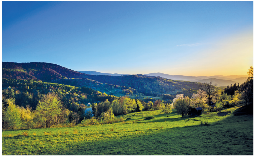
Krajobraz Gminy Jeleśnia / Krajinu obce Jeleśnia

Gmina Jeleśnia położona jest w północnej części Beskidu Żywieckiego, w Powiecie Żywieckim, w Województwie Śląskim. W skład Gminy wchodzi dziewięć sołectw: Jeleśnia, Korbiewów, Krzyżowa, Krzyżówki, Mutne, Pewel Wielka, Przybórowe, Sopotnia Mała i Sopotnia Wielka. Gmina Jeleśnia od wschodu graniczy z gminą Koszarawa, od zachodu z gminami Świnna, Radziechowy Wiewprz i Węgierska Górka. Od południa z gminą Ujsoły, a od północy z gminami należącymi do województwa małopolskiego - Lachowice i Zawoja. Południową granicę Gminy stanowi granica z Republiką Słowacją.