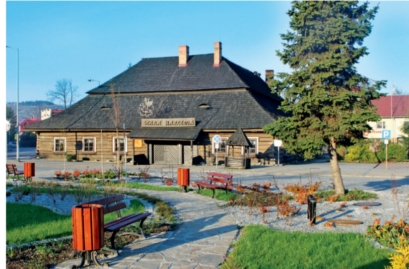
Stará Karczma w Jeleśni / Stará Ruka w Jeleśni

Najcennejšim památkou potvrzující staletou historii Jeleśnie je Stará krčma. Hostinec se nacházel na obchodní stezce vedoucí ze Žyvice na Slovensko, vedle křižovatky cest, poblíž kostela sv. Wojciech. Jedná se o jednopatrovou budovu se dvěma křídly umístěnými v pravém úhlu, s průčelím orientovaným na východ. Hostinec je zastřešen obrovskou lomenou polskou střechou ze šindelů s komín. Jeho prostorný interiér má klasické členění pokojů se silně exponovanou křmou, známou také jako hlavní místnost. Hostinec sehrál v životě obce důležitou roli. Kanaly se zde svatby, křtiny, zábavy a zastavovaly se pěší poutě ze Slovenska do Kalvarie Zbrzydowské a Čenstochové. V současné době je ve Staré Karczme restaurace.