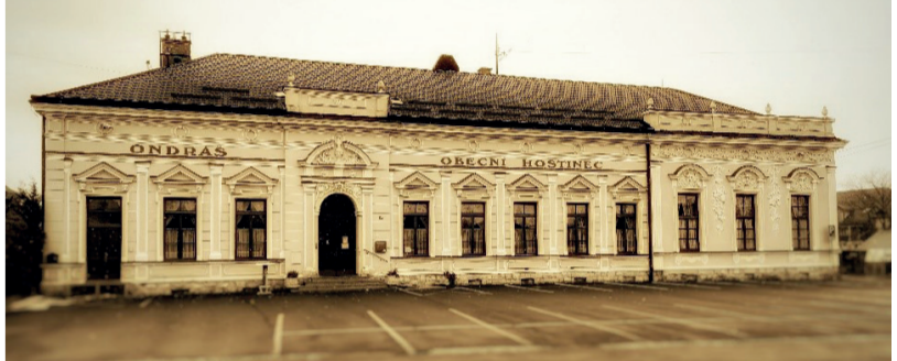
Restauracia Ondráš / Restaurace Ondráš

Obsar Sviadnov je středně veľkou obcí nachádzajúci sa v okrese Frýdek-Místek v susedství štatutárneho mesta Frýdek-Místek. Sviadnov má spíše průmyslový charakter se silným záplečím pro firmu a podnikání, včetně několika velkých průmyslových areálů. Obec má průměrnou nad mořskou výškou 277 m n.m., nejvyšším bodem je 80metrový kopec Štándl ve výšce 356 m n.m. Sviadnov patří mezi nejstarší obce v regionu – jeho počátky se datují do roku 1267 (tehdy pod názvem Zwenser). Od poloviny 70. let 20. století byla obec součástí města Frýdku-Místku v rámci uplatňovaného přidružení obcí, na počátku roku 1992 se Sviadnov z iniciativy místních občanů stal opět samostatnou obcí. V této době se také nastartoval výrazný rozkvět obce (zavedení kanalizace, rozvoj bydlení), který akceleroval po roce 2000. Obec má v současné chvíli 2148 obyvatel. Jedná se dominantně o složení obyvatel české národnosti. Obec je vsazena mezi řeky Ostravicí na severovýchodní straně a říčkou Olešnou na jihozápadní straně.