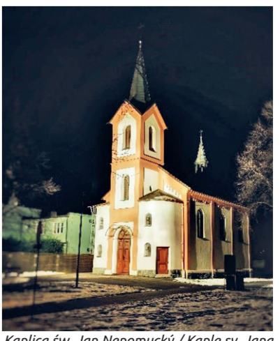
Kaplica św. Jan Nepomucký / Kaple sv. Jana Nepomuckého

Velká kaple připomínající spíše malé kostelík je největší církevní stavbou ve Sviadnově. Zsvěcená je svatému Janu Nepomuckému. Nejprve byl roku 1885 vybudován nedaleký hřbitov z nařízení města Frýdku-Místku. K výstavbě samotné kaple se přistoupilo až v roce 1887 a na její stavbu obec pořádala sbírku.