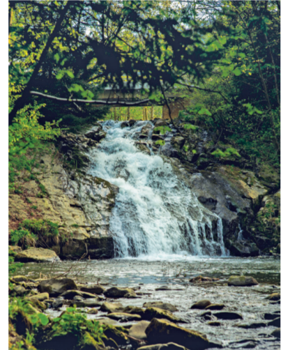
Wodospad w Sopotni Wielkiej / Vodopád v Sopotni Skvělé