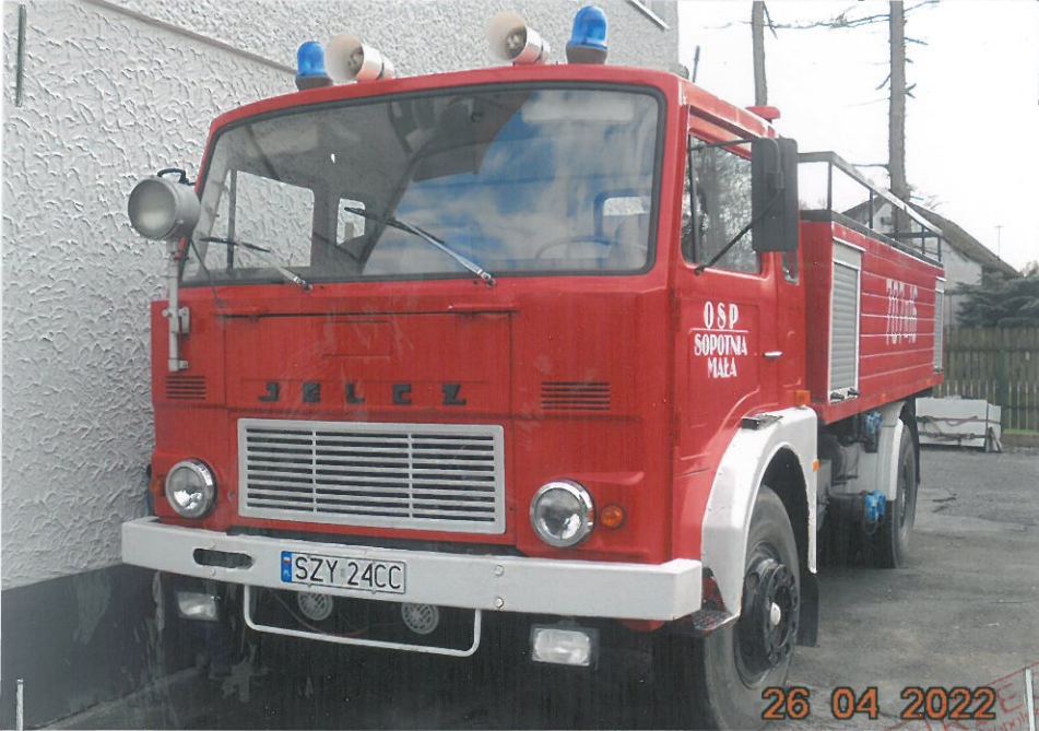
Ujęcie samochodu z przodu

MATERIAŁ POGLĄDOWY – dok .fot. załącznik do operatu szacunkowego nr 6/ 22/UG/J samochodu specjalnego – pożarniczy Jelcz 004 , o nr rej. SZY 24CC