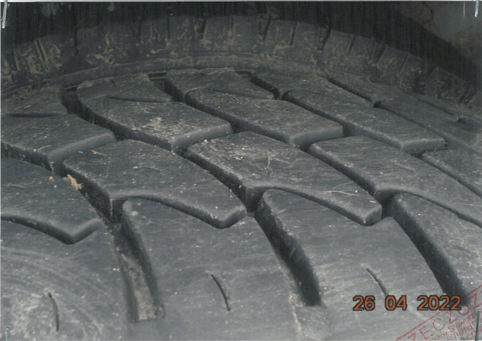
(14) Ujęcie bieżnika – na ogumieniu widoczny znaczny stopień starzenia się ogumienia .