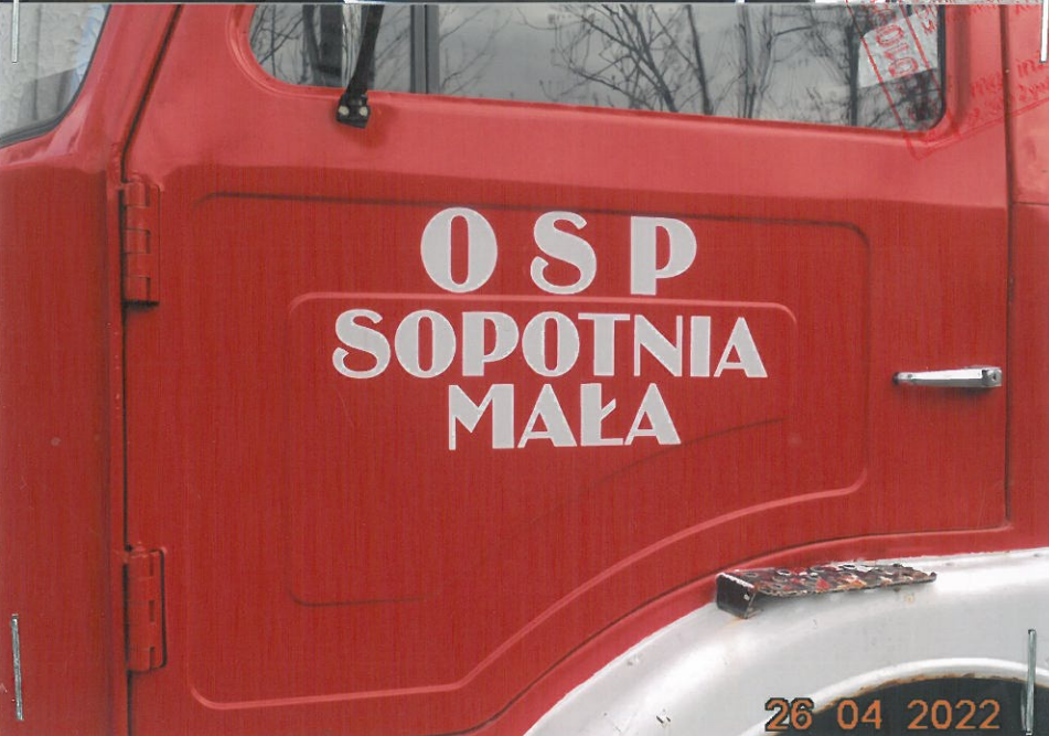
Przynależność samochodu znajdującego się na Poddziale Bojowym OSP Sopotnia Mała .