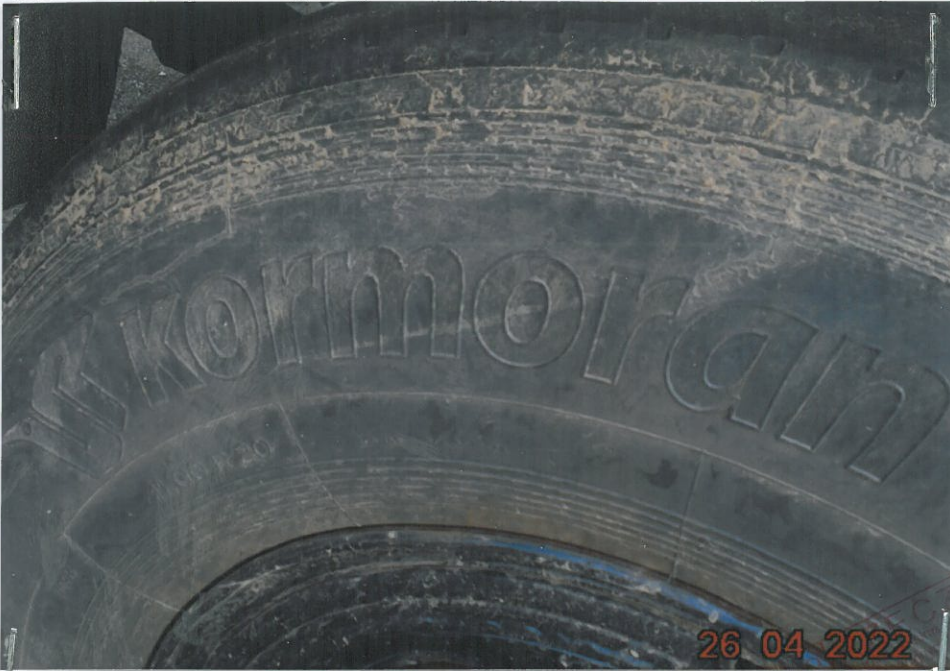
(13) Ujęcie ogumienia samochodu . Rozmiar 11.00 R 20 , marki Kormoran

MATERIAŁ POGLĄDOWY – dok .fot. załącznik do operatu szacunkowego nr 6/ 22/UG/J samochodu specjalnego – pożarniczy Jelcz 004 , o nr rej. SZY 24CC