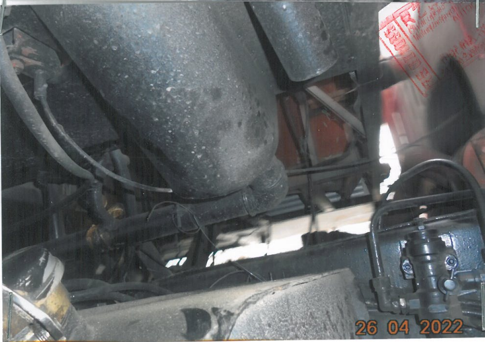
(17) Ujęcie samochodu od dołu. Widoczna konserwacja ramy samochodu . Samochód , jego rama i dolna część bardzo dobrze zakonserwowana .

RZECZOWNAWCA Biuro rzeczoznawców Technicznych i Urzędów 15 117 mgr Grzegorzek 34-300 Żywiec, ul. Szkolna 1/4, tel. 33 865 21 92