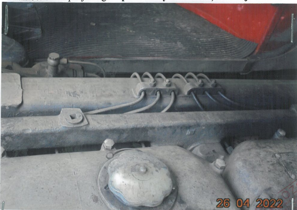
(16) Ujęcie silnika SW 680/105 - pokrywy układu rozzządu – korek do wlewania oleju silnikowego .

MATERIAŁ POGLĄDOWY – dok .fot. załącznik do operatu szacunkowego nr 6/ 22/UG/J samochodu specjalnego – pożarniczy Jelcz 004 , o nr rej. SZY 24CC