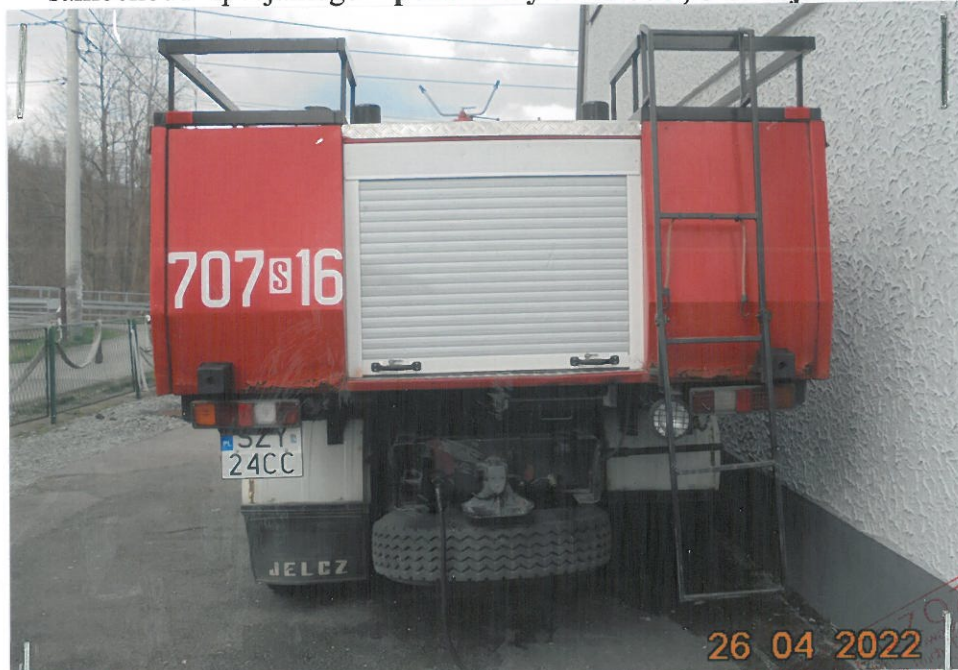
Ujęcie samochodu z tyłu

MATERIAŁ POGLĄDOWY – dok .fot. załącznik do operatu szacunkowego nr 6/ 22/UG/J samochodu specjalnego – pożarniczy Jelcz 004 , o nr rej. SZY 24CC