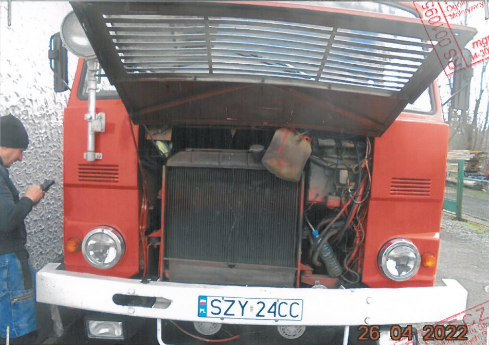
Ujęcie samochodu z przodu po podniesieniu kraty wlotu powietrza