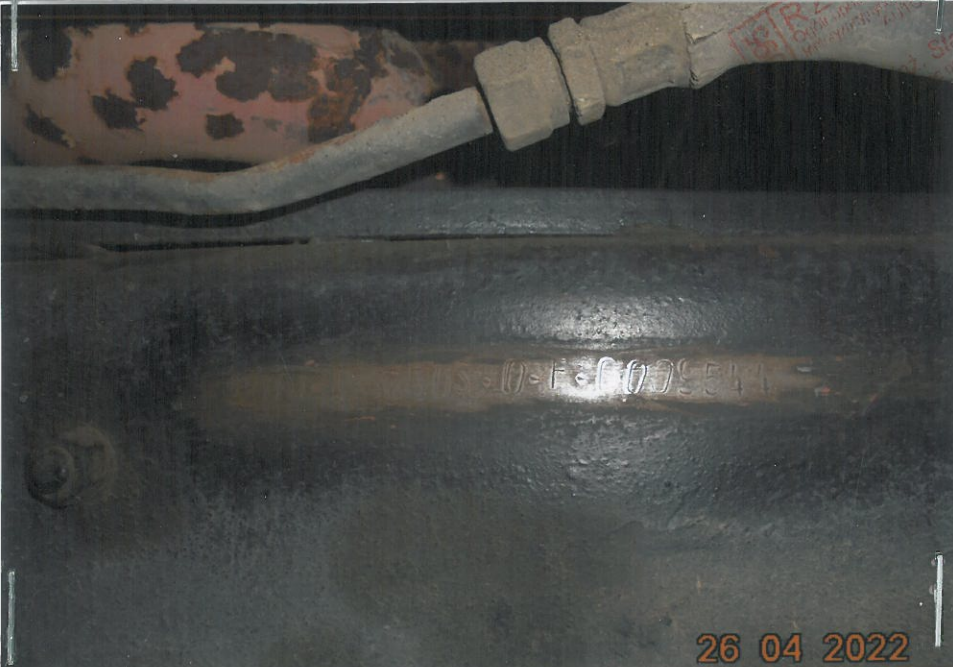
Ujęcie prawej przedniej strony ramy samochodu. Naprzeciw prawego przedniego koła wybito sztańcą nr VIN :

UJG325DS0F000954 ( wybito 18-cie znaków)