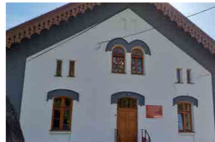
Zespół Szkół nr 7 oraz Przedszkole w Przyborowie