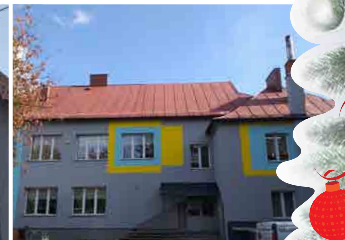
Szkoła Podstawowa Sopotnia Wielka