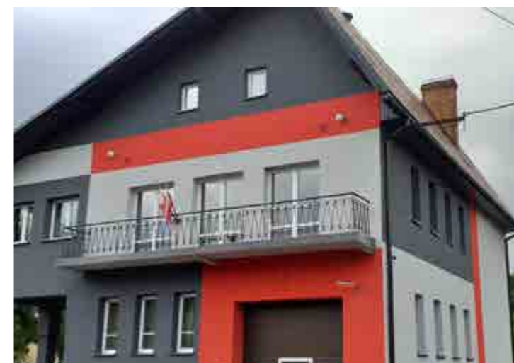
Budynek OSP Przyborów