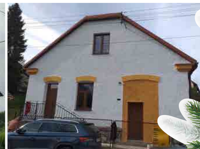
Dom kultury Sopotnia Mała